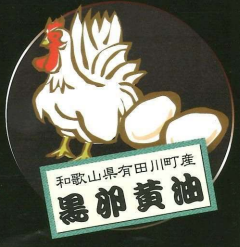
和歌山県有田川町産 黒卵黄油