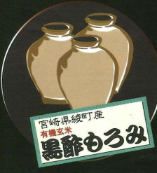
宮崎県綾町産 有機玄米 黒酢もろみ