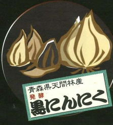
青森県天間林産 第1特許 黒にんにく